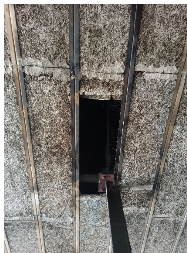
Pozn. stávající podhled v garážích (heraklitové desky + ocelové svařované T profily)